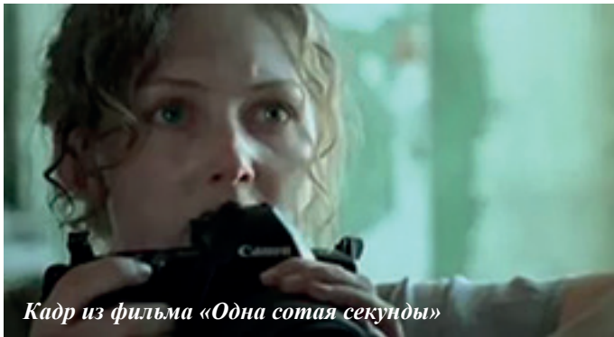
Кадр из фильма «Одна сотая секунды»

ли время, место. Обычно журналисты не принимают