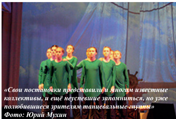
«Свои постановки представили и многим известные коллективы, и ещё неуспевшие запомниться, но уже полюбившиеся зрителям танцевальные группы»

вновь и не уходить оттуда никогда. Все это можно коротко назвать магией сцены. Для некоторых это ничем не примечательное место, но для танцора это место особенное. Здесь его душа сливается с музыкой, а тело рассказывает историю от начала и до конца.