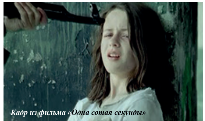
Кадр из фильма «Одна сотая секунды»