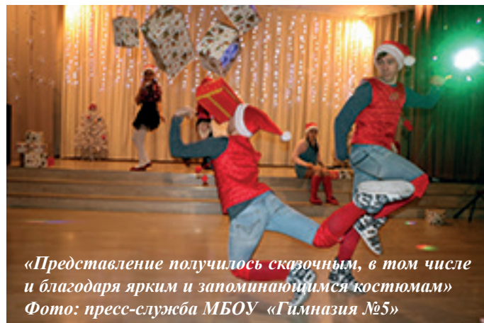
«Представление получилось сказочным, в том числе и благодаря ярким и запоминающимся костюмам»

Спектакль удался и благодаря музыкальному сопровождению, которое в этом году было особенно современным и необычным. В этот раз ребята уделили особое внимание мелким звукам, как звон разбитого зеркала или шум телевизора, из которого разносятся всем известные строчки из любимого новогоднего фильма «Ирония Судьбы, или С легким паром».