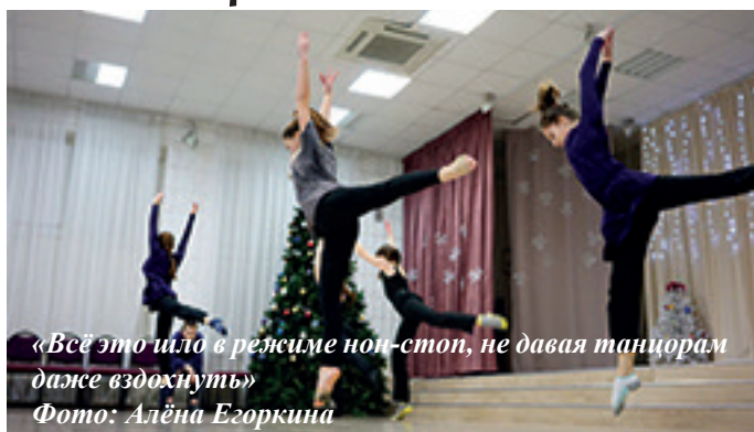
«Всё это шло в режиме нон-стоп, не давая танцорам даже вздохнуть»

25 декабря основной состав коллектива «Контраст» подготовил новогодний праздник для самых маленьких танцоров. Но для коллектива это был не только детский утренник, но также и открытый урок. Юные танцоры показали свои умения в разных областях современ-