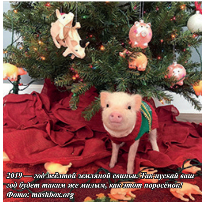
2019 — год жёлтой земляной свиньи. Так пускай ваш год будет таким же милым, как этот поросёнок!

чение. Необязательно быть супер-спортсменом, чтобы заняться каким-либо спортом, поэтому скорее бери с собой друзей и отправляйся с ними кататься на коньках, лыжах, а может даже на сно-