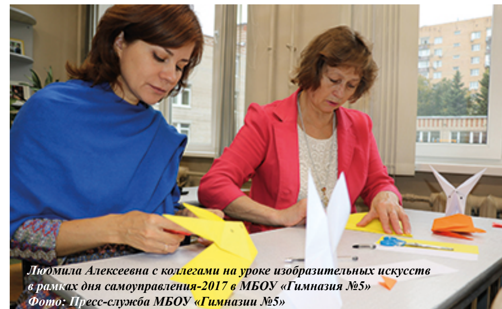
Людмила Алексеевна с коллегами на уроке изобразительных искусств в рамках дня самоуправления-2017 в МБОУ «Гимназия №5»

Л.А: Я думаю, что иногда терпение выслушать до конца, тогда, когда кажется, что уже не можешь сидеть спокойно и слушать