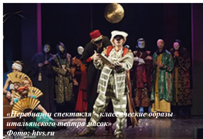
«Персонажи спектакля – классические образы итальянского театра масок»

Никита: Впечатления у меня положительные. Мне очень понравилось то, что все были в масках, невозможно было выявить возраст актёра, могли кого-то состарить, кого-то омолодить. Ещё, как я понял, в костюмах смешались две культуры: Китай и Италия. Понравилась отсылка к современности.