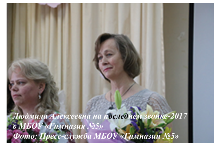
Людмила Алексеевна на последнем звонке-2017 в МБОУ «Гимназия №5»

будет нужно. А если человек будет никчемный, то ему трудно будет. Придется сначала себя воспитать, а потом уже учиться чему-то.