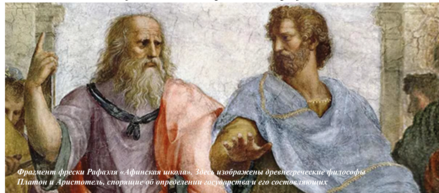
Фрагмент фрески Рафаэля «Афинская школа». Здесь изображены древнегреческие философы Платон и Аристотель, спорящие об определении государства и его составляющих

Сентября по ноябрь проходит всероссийский фестиваль «Наука 0+», основная цель которого популяризация науки среди всех слоёв населения. Фестиваль затрагивает разные сферы науки, а также другие смежные дисциплины – искусство и философию. Сегодня я расскажу Вам, в чём их сходства и различия и какова их взаимосвязь в истории мира и человечества.