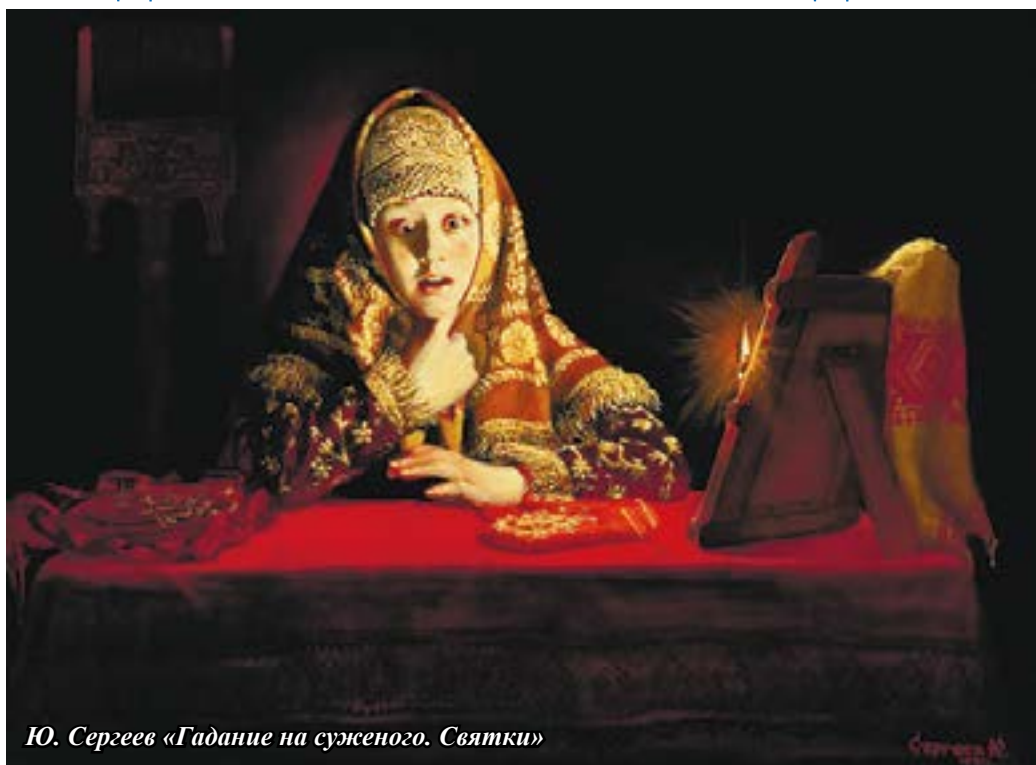
Ю. Сергеев «Гадание на суженого. Святки»

Бросать «за ворота башмачок» мне не позволяют родители. «Улетит он куда-нибудь — где тогда но-