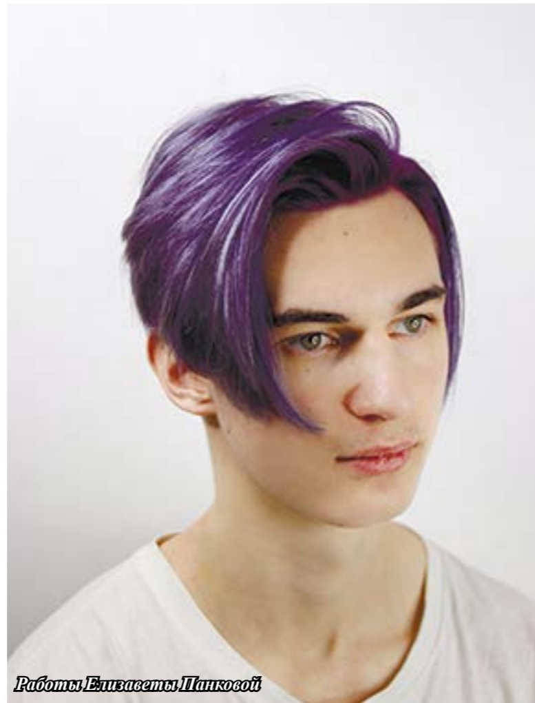
Работы Елизаветы Панковой

Лана: В основном учитываем пожелания клиента. Большинство ребят приходят к нам уже имея в голове картинку того, что они хотят, либо просто показывают фотографию готового окрашивания. В случае, если гость совсем-совсем не