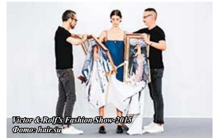
Victor & Rolf's Fashion Show-2015

Нам только кажется, что дизайнеры сошли с ума, но когда-то и купальники считались чем-то невозможным. Задумайтесь, возможно, в будущем мы будем носить такую одежду, что сейчас у нас в сегменте