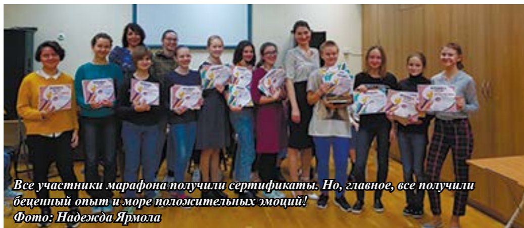
Все участники марафона получили сертификаты. Но, главное, все получили бесценный опыт и море положительных эмоций!

В конце соревнований у участников, прошедших все испытания, была возможность получить приз зрительских симпатий, звания «Лучший марафонец» и «Комментатор 80 уровня» — номинация для тех, кто хочет выступать в качестве эксперта, комментируя конкурсные работы участников, давая советы,