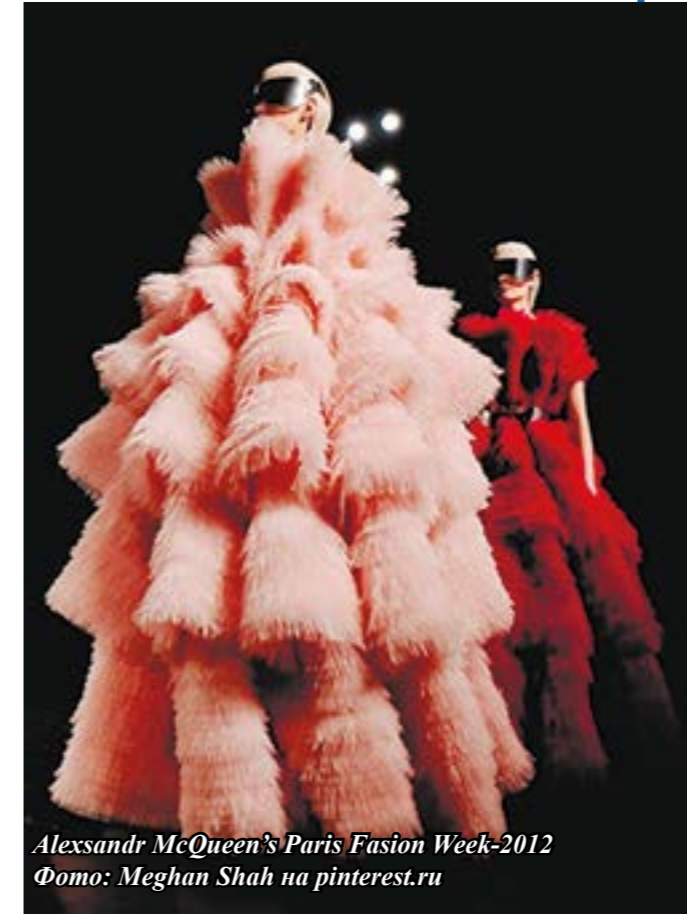
Alexsandr McQueen's Paris Fashion Week-2012

В Интернете мы можем встретить множество фотографий с модных показов, где одежда нам покажется ересью. Ведь человек в этой одежде на человека-то не похож! И уже написано множество статей «Куда катится мир?», «Что творят дизайнеры?» и тому подобное. А вы не пробовали их понять? Может, у них есть причина создавать такую странную продукцию?