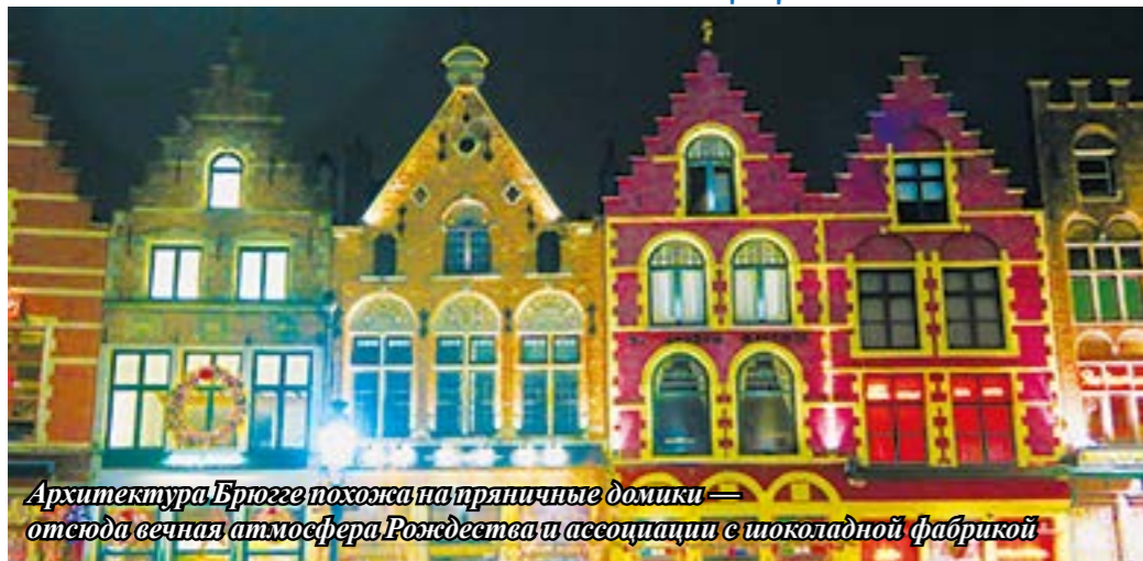
Архитектура Брюгге похожа на пряничные домики — отсюда сечная атмосфера Рождества и ассоциации с шоколадной фабрикой