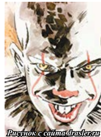
Рисунок с сайта drasler.ru