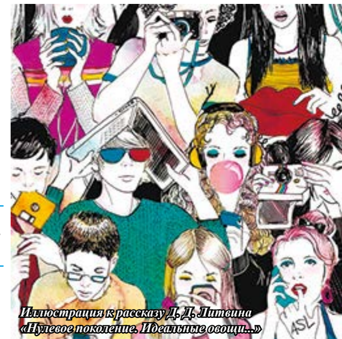
Иллюстрация к рассказу Д. Д. Литвина «Нулевое поколение. Идеальные овощи...»

Но такие компании скорее частный случай, чем по-