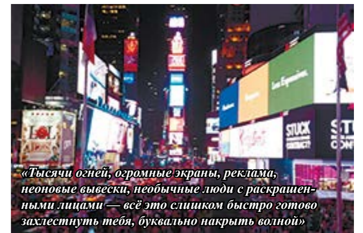
«Тысячи огней, огромные экраны, реклама, неоновые вывески, необычные люди с раскрашенными лицами — всё это слишком быстро готово захлестнуть тебя, буквально накрыть волной»

земную транспортную сеть мира. Как же я была счастлива, что смогла выйти обратно. Нью-Йорк не оставляет впечатление чистого города, но то, что творится в метро, сложно описать — много бездомных, вонь и сырость, поезда, принцип работы которых я так и не поняла. Жуткое место — если есть возможность ездить на автобусе или такси, то, мой вам совет — лучше вниз не спускаться.