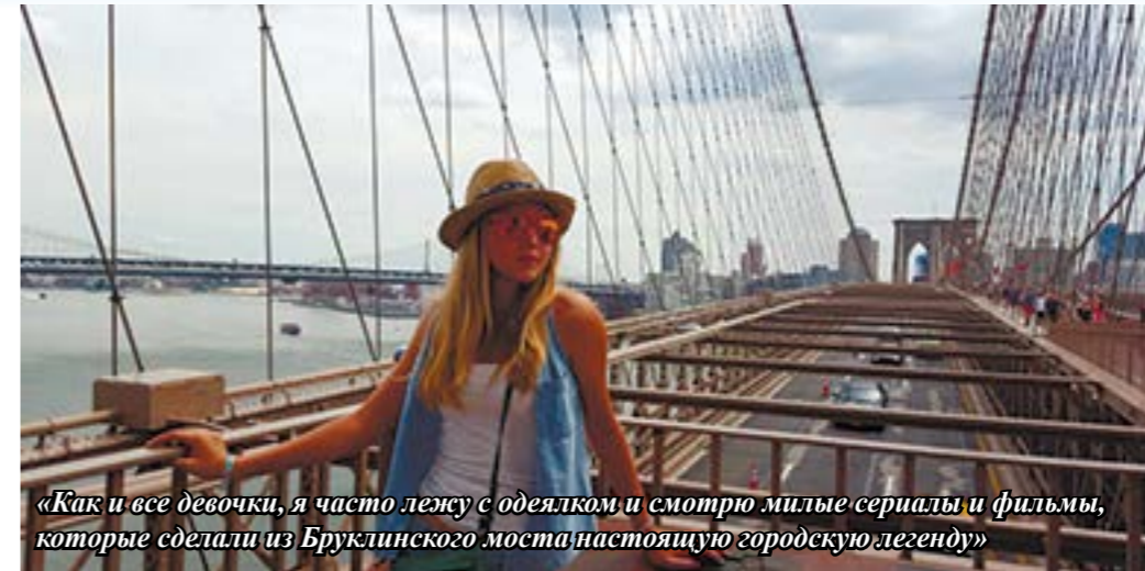
«Как и все девочки, я часто лежу с одеялком и смотрю милые сериалы и фильмы, которые сделали из Бруклинского моста настоящую городскую легенду»

Понимая, что времени осталось совсем немного и послезавтра меня ожидает