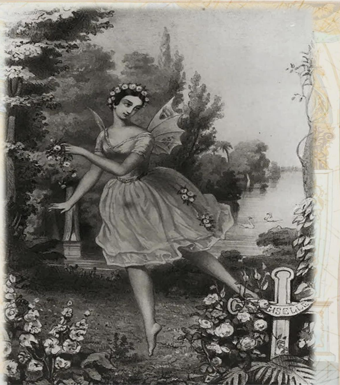
48. Carlotta Grisi in Giulio . Act II. Album de Théâtre, no. 1

К середине XVIII века балет завоевывал большую популярность в Европе. Все аристократические дворы Европы стремились подражать роскоши французского королевского двора. В городах открывались оперные театры. Многочисленные танцовщицы и учителя танцев легко находили себе работу.